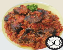
IKAN SOUS CAKALANG